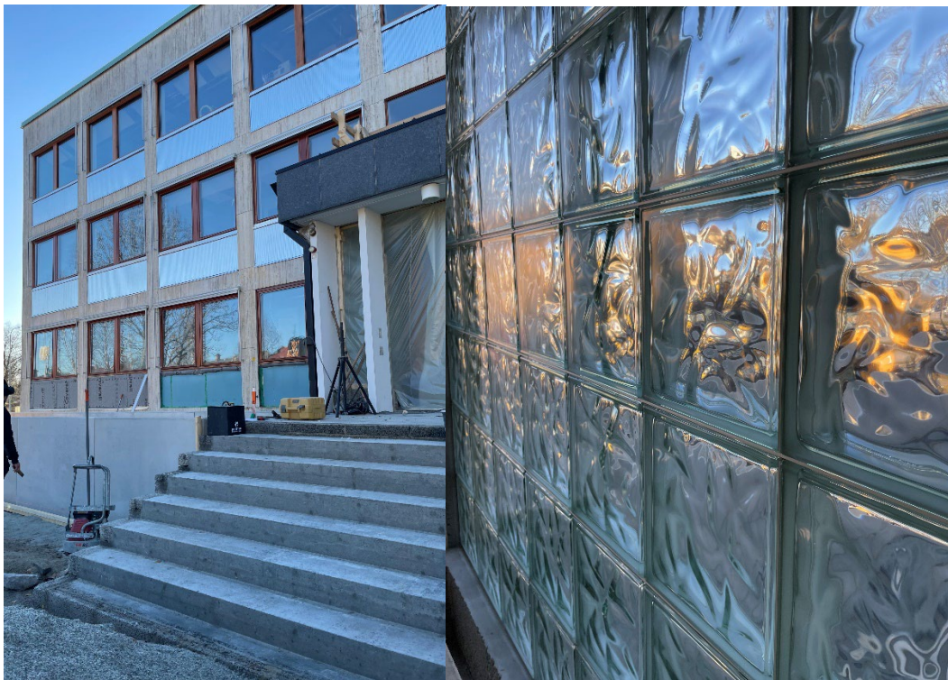
Utvändigt pågår arbete med rampen och innanför entrén har glasbetongen bytts ut.

Även inne i kontorslandskapen har detaljer i ek pockats upp i pentryn och dörrar. En blandning av gamla och nya detaljer är något som det arbetats mycket med under projekteringen för att förstärka husets karaktär.