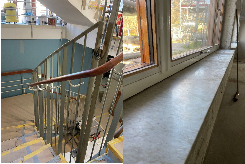
Nya trappräcket har kommit på plats i delar av trapphuset. I lunchrummet har befintliga fönsterbrädor återmonterats.